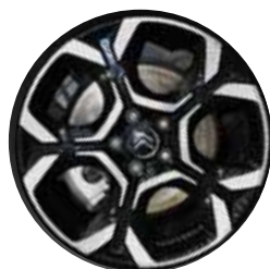
Lichtmetaal 18" PULSAR 225/55 R18