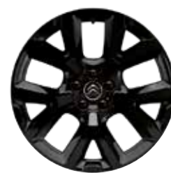
Lichtmetaal 19" ART Black 205/55 R19 225/50 R19