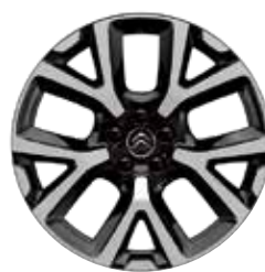
Lichtmetaal 19" ART 205/55 R19 225/50 R19