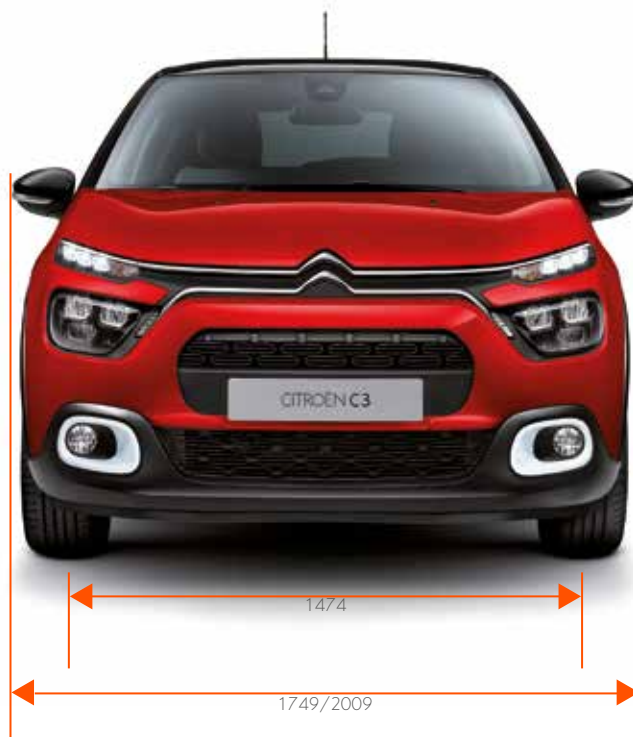
Breedte / Breedte met uitgeklapte buitenspiegels