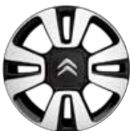
Lichtmetaal 16" Diamantée MATRIX 205/55 R16V