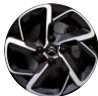
Lichtmetaal 16" Diamantée Two Tone HELLIX 205/55 R16V